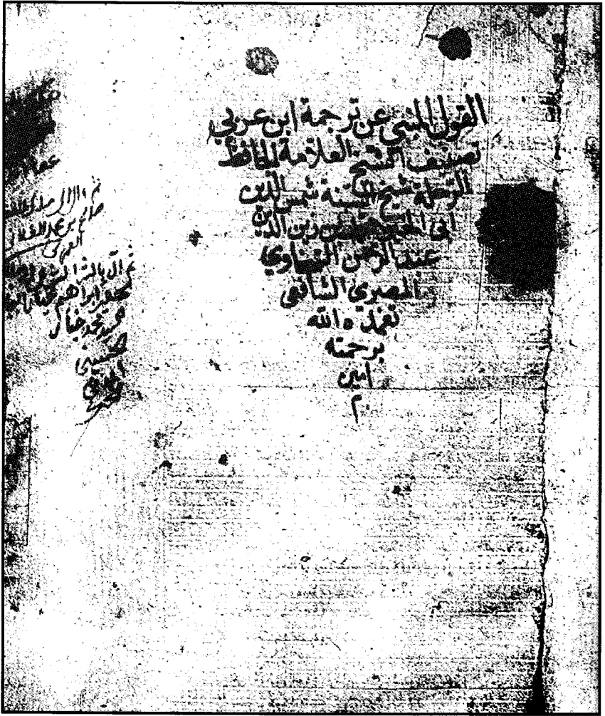
غلاف «القول المنبئ» للسخاوي (ت: ٩٠٢هـ) نسخة تشستر بيتي (٤٨٧٨)